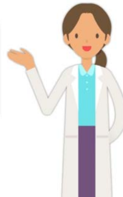
Animation published by HealthBreeze